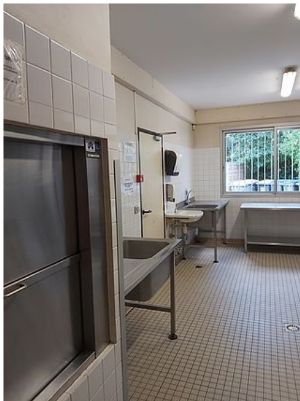
Cuisine située au rez-de-chaussé de la grande salle