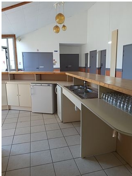
Bar de la grande salle avec ses 150 petits verres