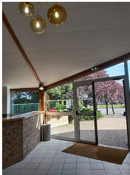
Entrée de la grande salle