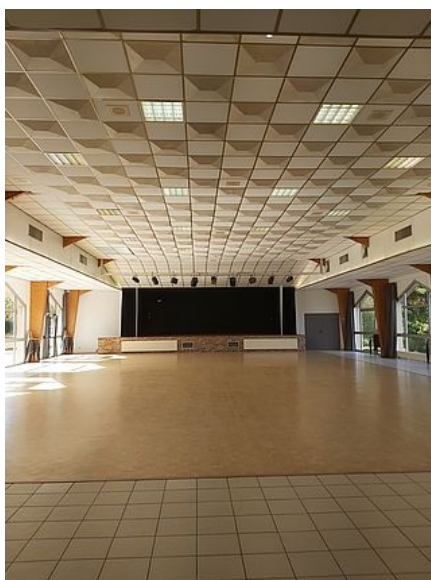
Intérieur de la salle

Capacité de 534 personnes dont 360 assises ( 477m 2 ).