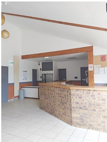
Vue d'ensemble sur le bar avec le monte plats