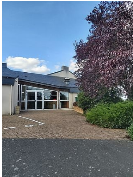
Extérieur de la grande salle