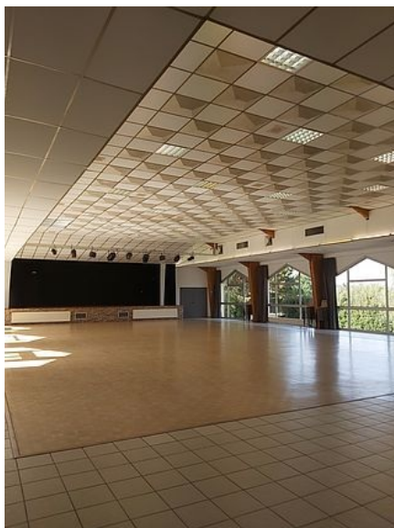
Intérieur de la salle avec scène