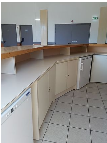
Le bar avec ses 3 petits frigos